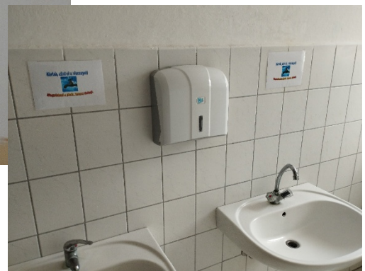
Energiaórség 2025. GYO.