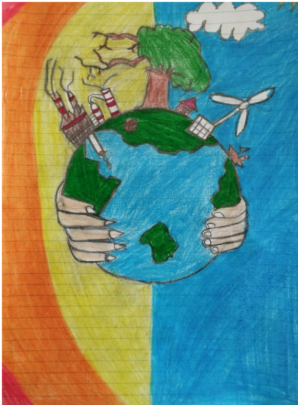
Tanulj a Földért! – készítette Tóth Ramóna 6.o. GYO.